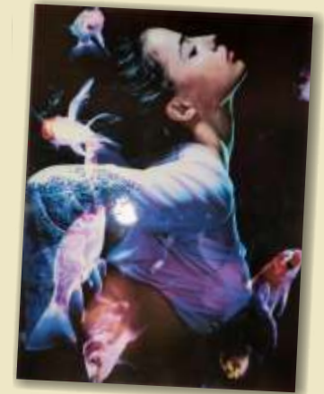
rechts dekorativ als Bild

Heizen mit InfraPower-Heizelementen bedeutet ökologisch und ökonomisch sinnvoll Heizen! Beachten Sie unsere Investitions- und Kostenrechnungen!