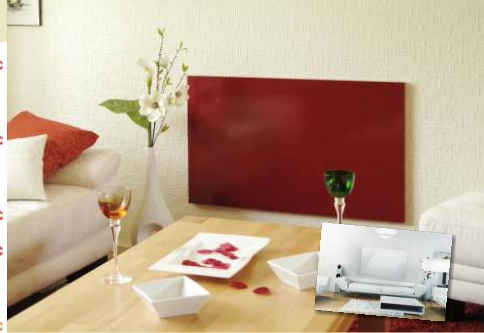
oben Dekorative Wandgestaltung

Heizen mit InfraPower-Heizelementen bedeutet ökologisch und ökonomisch sinnvoll Heizen! Beachten Sie unsere Investitions- und Kostenrechnungen!